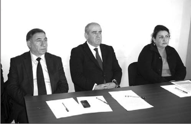
Qobustan rayon Təklə Mirzəbaba kənd tam orta məktəbində Qobustan Rayon İcra Hakimiyyətinin başçısı Adil Məmmədov Təklə Mirzəbaba kənd sakinləri ilə səyyar görüşü keçirdi. Görüşdə Rayon İcra Hakimiyyəti başçısının müavin-